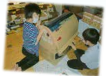
段ボールで工作中