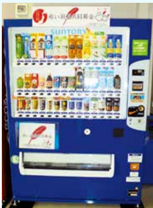
赤い羽根自動販売機（イメージ）

町共同募金委員会（町社会福祉協議会内） 本 所：TEL 65-5360 FAX 65-5450 大野事務所：TEL 77-2180 FAX 77-2181