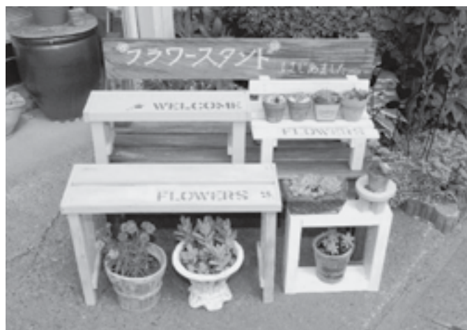
☆木製フラワースタンド等木製雑貨 100円～1,500円程度

当事業所の利用者さんが心を込めて製作した製品を販売していますので、是非、お手に取ってお確かめください。