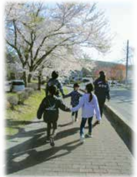
季節を感じながらお散歩

当法人で運営する放課後等デイサービスまきばは、平成28年4月11日に開所し、もうすぐ7年目を迎えます。