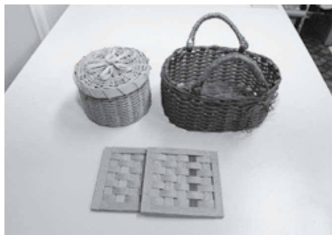
☆クラフトバンド製品 100円～1,000円程度