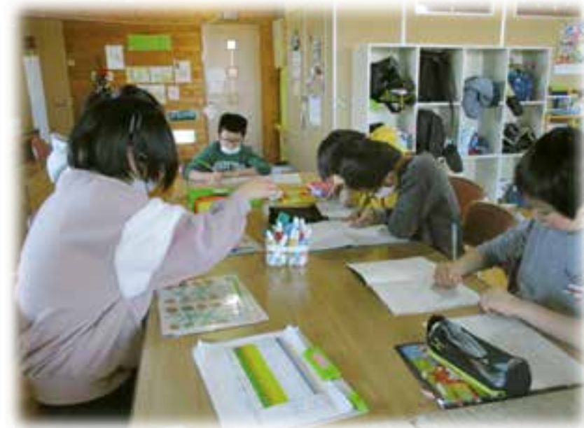
学習の時間を設けています