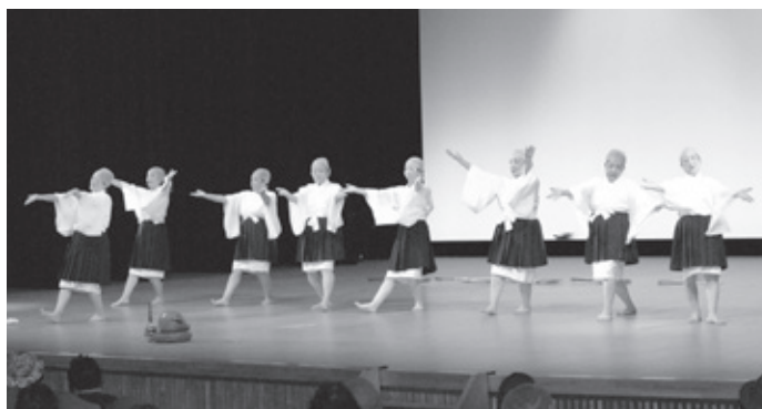
会場を笑いに包んだ鹿糠婦人会の皆さん