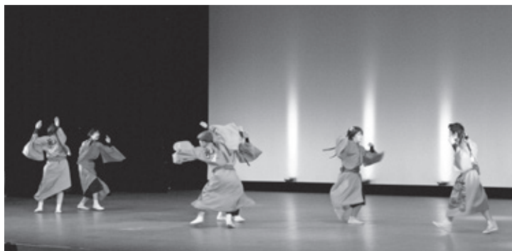
迫力がある踊りを披露したてんつく連の皆さん