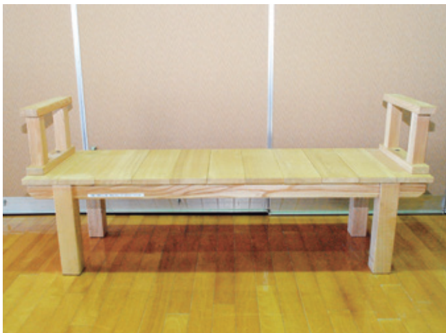
寄贈していただいた手づくりベンチ

このほど、町立大野小学校6年生より昨年度の総合的な学習の時間「一人一芸の村に生まれて」の学習で、大野の地域資源である木材を使用して製作した手づくりベンチを寄贈していただきました。11月30日に同校で行われた贈呈式では、生徒より取り組んだ学習の目的や感想などの発表があり、特別養護老人ホーム久慈平荘様と当協議会へ1台ずつ贈呈されました。当協議会へ寄贈していただいた手づくりベンチは、大野福祉センターへ設置し、大切に使用させていただきます。この度は、誠にありがとうございました。