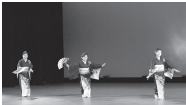
息の合った舞踊を披露した向田婦人会の皆さん