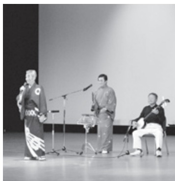
老人クラブ連合会の皆さんによる「外山節・津軽タント節」の様子