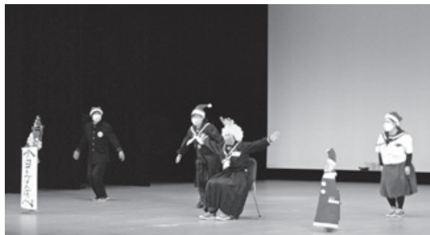
オープニングを飾った城内婦人会の皆さん

なお、前売券の売り上げや寄附金など大会の収益金235,578円は、歳末たすけあい運動に向けて、岩手県共同募金会洋野町共同募金委員会へ全額寄付され、寝たきりの高齢者や障がいがある方等のために有効に活用されます。