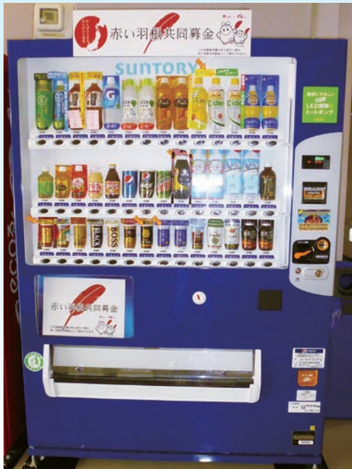
赤い羽根自動販売機（イメージ）

岩手県共同募金会洋野町共同募金委員会では、地域福祉を推進するための財源確保のため、「赤い羽根自動販売機」の設置推進に取り組んでいます。この自動販売機は、清涼飲料水の自動販売機による売り上げの一部を寄付していただくもので、この募金は「ふれあいいきいきサロン事業」「子ども食堂支援事業」等、設置した地域の様々な地域福祉活動に活用されます。