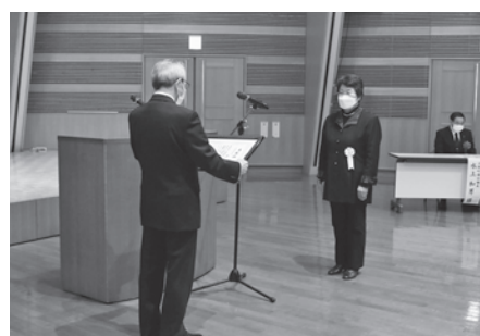
洋野町社会福祉協議会長表彰を受賞する絆の会様