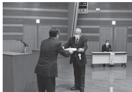
洋野町長表彰を受賞する大町江戸ヶ浜老人クラブ様