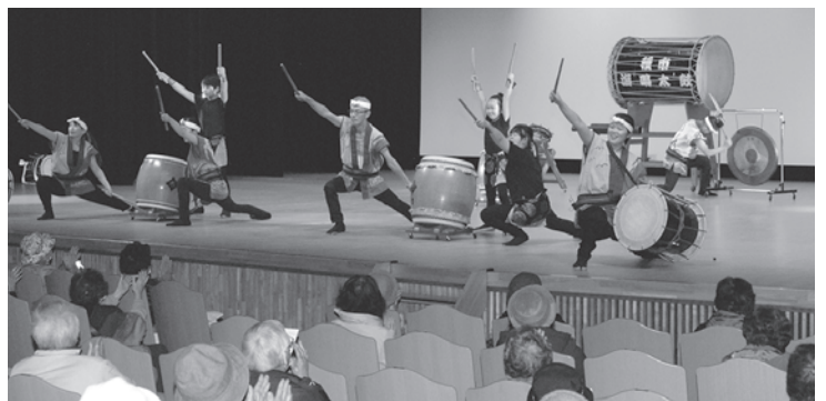
歳末たすけあい運動の一環として3年ぶりに開催された歳末たすけあい隠し芸大会の様子