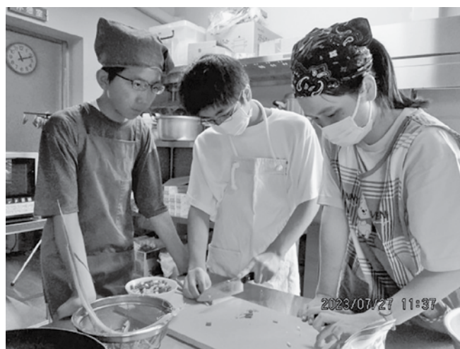
収穫したミニトマトをのせたピザを作っています。

放課後等デイサービスまきばでは、サービス利用や制度及びお子様の成長に関すること等、随時相談を受け付けております。また、当法人では指定特定相談支援事業（障害者・障害児）も行っており、相談支援専門員が3名常駐しておりますので、お気軽にお問合せ下さい。