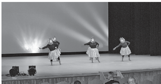
ユーモア溢れる演出で会場を沸かせた鹿糠婦人会の皆さん