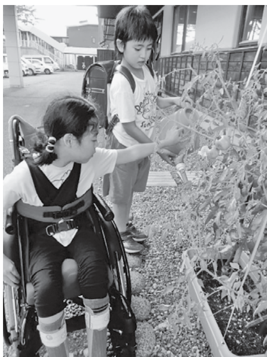
はじめてミニトマトの栽培に挑戦しました！