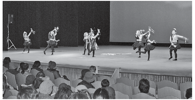
オープニングを飾った八木こども園の皆さん

なお、前売券の売り上げや寄附金など大会の収益金230,782円は、歳末たすけあい運動に向けて、岩手県共同募金会洋野町共同募金委員会へ全額寄付され、寝たきりの高齢者や障がいがある方等のために有効に活用されます。