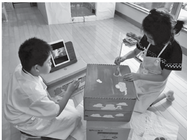
創作活動中！段ボールでおかたづけBOXを作成しました。

放課後等デイサービスまきばでは、サービス利用や制度及びお子様の成長に関すること等、随時相談を受け付けております。また、当法人では指定特定相談支援事業（障害者・障害児）も行っており、相談支援専門員が3名常駐しておりますので、お気軽にお問合せ下さい。