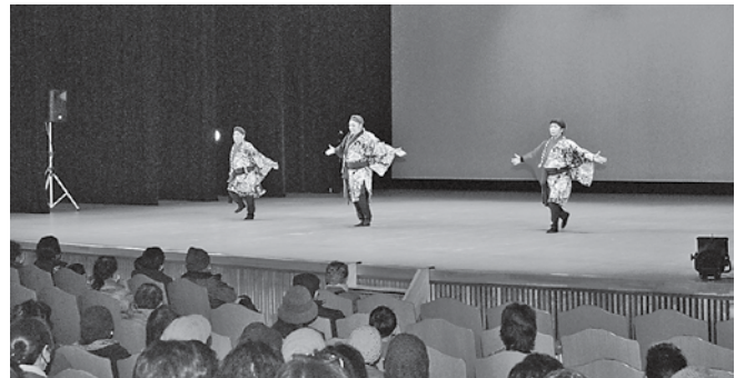
力強い踊りを披露したもみじ好友会の皆さん