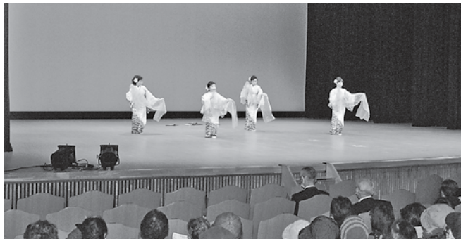
息の合った踊りを披露した宿戸婦人会の皆さん