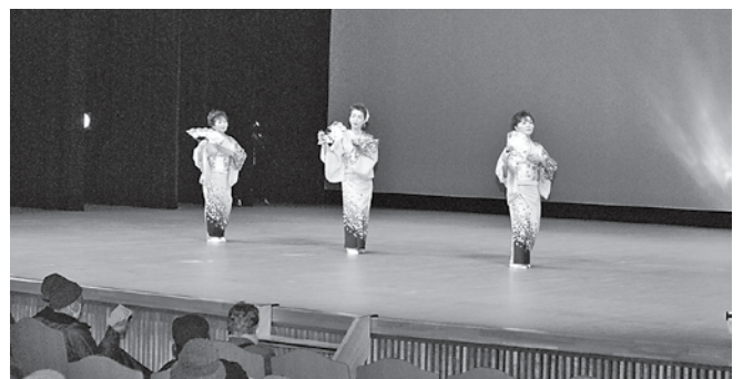
帯島連合婦人会の皆さんによる「大和路の恋」の様子