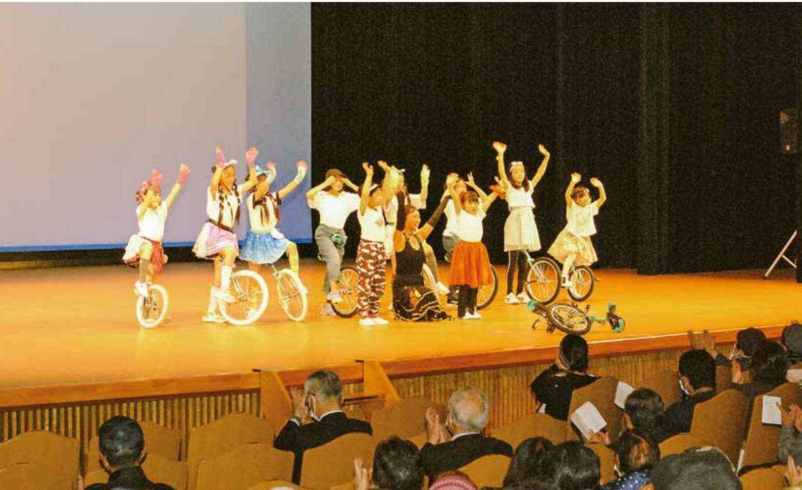
これまでの練習の成果を披露し、会場を大いに沸かせた「ひろの一輪車クラブ」の皆さん

恒例の洋野町歳末たすけあい隠し芸大会（主催：洋野町歳末たすけあい隠し芸大会実行委員会）が令和5年12月3日（日）、町民文化会館大ホールで盛大に開催されました。