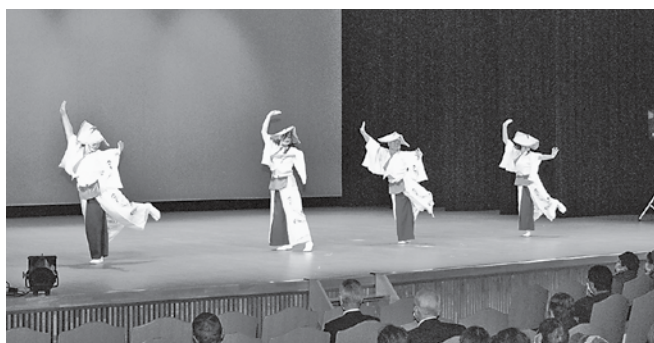
大会フィナーレを飾ったてんつく連の皆さん