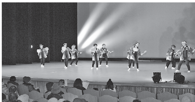
玉川婦人会の皆さんによる「お祭りマンボ」の様子