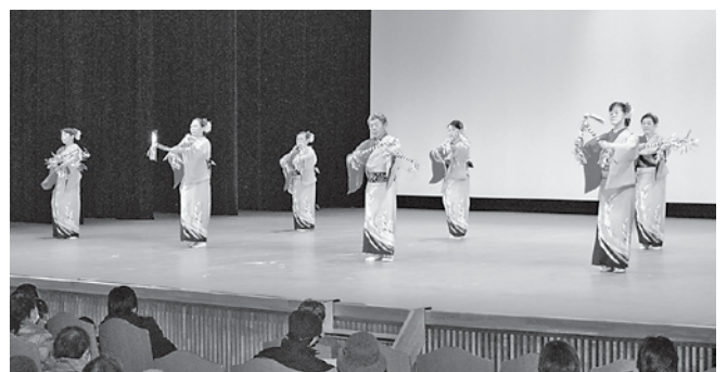
「花のっぽん総踊り」を披露した大野フレンドシップ会の皆さん