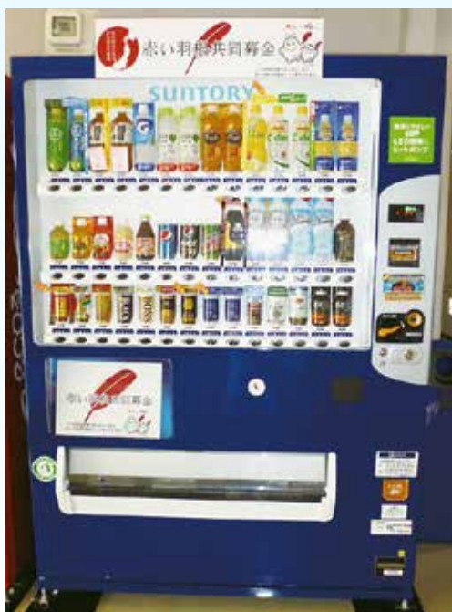
赤い羽根自動販売機（イメージ）

岩手県共同募金会洋野町共同募金委員会では、地域福祉を推進するための財源確保のため、「赤い羽根自動販売機」の設置推進に取り組んでいます。この自動販売機は、清涼飲料水の自動販売機による売り上げの一部を寄付していただくもので、この募金は「ふれあいいきいきサロン事業」「一人暮らし高齢者給食サービス事業」等、設置した地域の様々な地域福祉活動に活用されます。