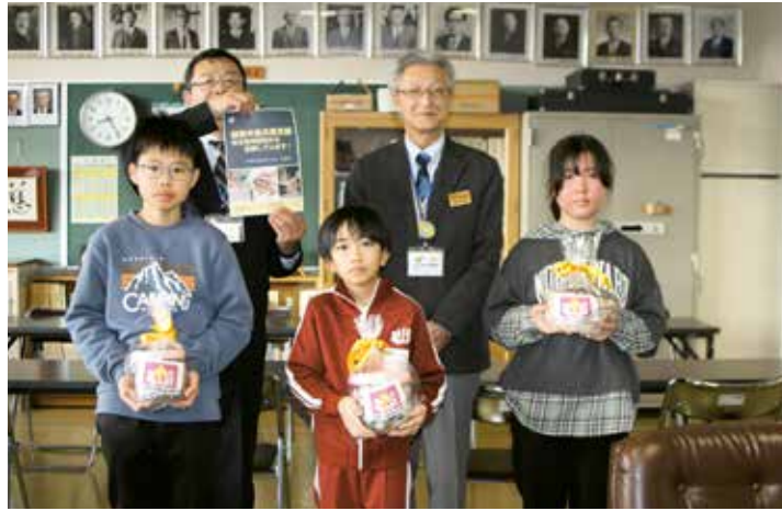
角 浜 小 学 校