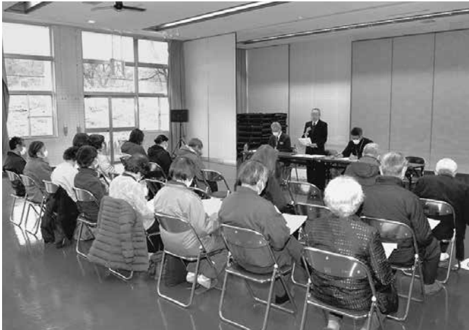
(写真上) 大野中学校区を対象に町大野農村環境改善センターで開催した懇談会の様子

懇談会で寄せられた意見や要望等を今後の社協活動に反映させていきたいと考えています。