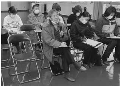
(写真右) 地域の現状や課題等について発言する参加者