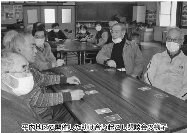
平内地区で開催した助け合い起こし懇談会の様子