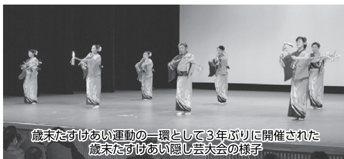
歳末たすけあい運動の一環として3年ぶりに開催された歳末たすけあい隠し芸大会の様子