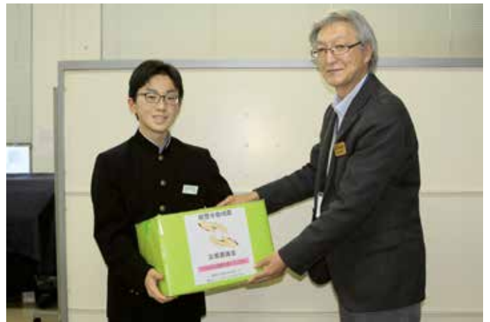
種 市 中 学 校

町内の小中学校様などから令和6年能登半島震災の1日も早い復興を願い、同地震災害義援金のご協力をいただきました。