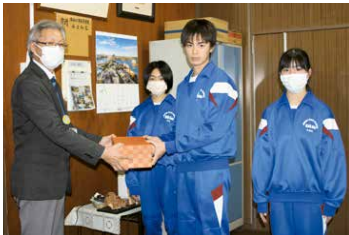
中 野 中 学 校