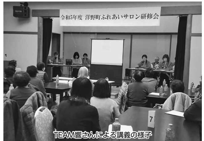
TEAM響さんによる講義の様子

この懇談会は、各地区のふれあいサロンに参加している高齢者等を対象に、日頃抱えている困りごとや福祉課題の解決方法を検討するとともに、気軽に『助けて!』と言える「助けられ上手」について話し合い、住民同士の支え合い・助け合いの地域づくりを推進することを目的に開催しているものです。