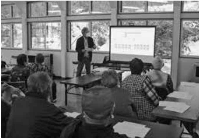
(写真上) くるみの会で 開催した懇談会の様子

各地区のふれあいサロンに参加している高齢者等を対象に、日頃抱えている困りごとや福祉課題の解決方法を検討するとともに、気軽に『助けて!』と言える「助けられ上手」について話し合い、住民同士の支え合い・助け合いの地域づくりを推進することを目的に助け合い起こし懇談会を開催し、たくさんの方々から参加をいただきました。