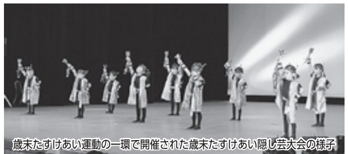
歳末たすけあい運動の一環で開催された歳末たすけあい隠し芸大会の様子