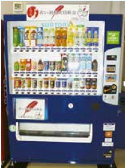
赤い羽根自動販売機（イメージ）

岩手県共同募金会洋野町共同募金委員会では、地域福祉を推進するための財源確保のため、「赤い羽根自動販売機」の設置推進に取り組んでいます。この自動販売機は、清涼飲料水の自動販売機による売り上げの一部を寄付していただくもので、この募金は「ふれあいいきいきサロン事業」「一人暮らし高齢者給食サービス事業」等、設置した地域の様々な地域福祉活動に活用されます。