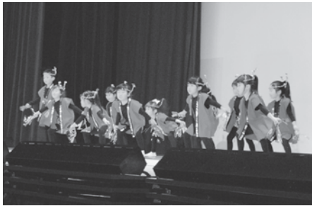
向田保育所4・5歳児の皆さんによる「親子よさこいDancing」の様子