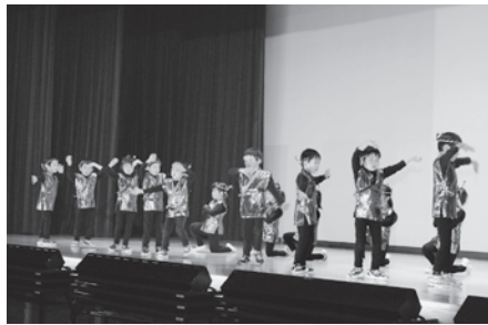
可愛らしいダンスを披露した大野保育所年長児の皆さん