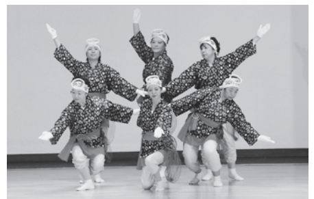
海女の衣装で踊りを披露した宿戸婦人会の皆さん