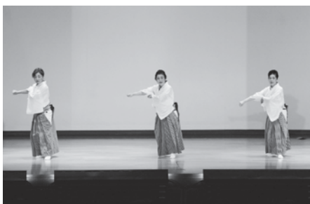
力強い舞踊を披露した町母子寡婦福祉協会の皆さん