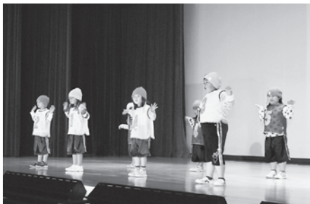
可愛らしいダンスでオープニングを飾った八木保育園さくら・ゆり組の皆さん