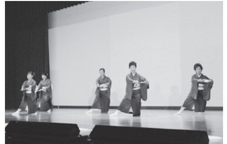
若柳流隆扇会の皆さんによる舞踊「琴の宴」の様子