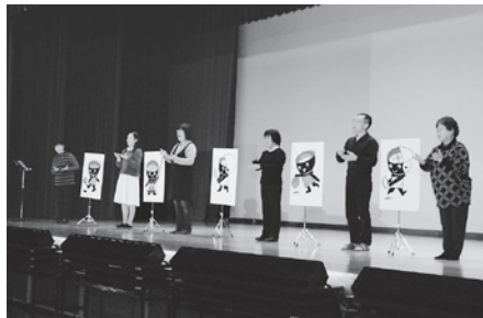
わんこきょうだいのうたに合わせて手話を披露したてっこの会の皆さん