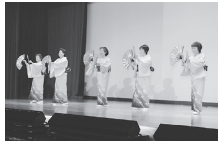
町婦人団体連絡協議会種市地区役員の皆さんによる「真室川音頭」の様子