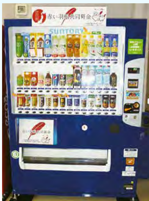
赤い羽根自動販売機 (イメージ)

岩手県共同募金会洋野町共同募金委員会では、地域福祉を推進するための財源確保のため、「赤い羽根自動販売機」の設置推進に取り組んでいます。この自動販売機は、清涼飲料水の自動販売機による売り上げの一部を寄付していただくもので、この募金は「ふれあいいきいきサロン事業」「一人暮らし高齢者給食サービス事業」等、設置した地域の様々な地域福祉活動に活用されます。