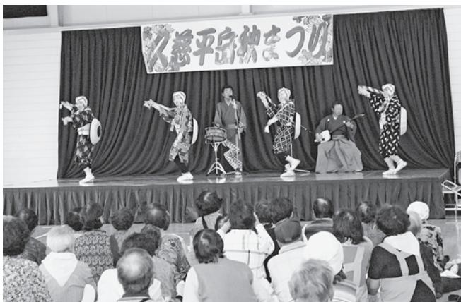
芸能団体によるステージ発表の様子