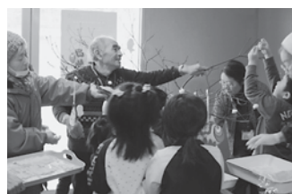
ふれあいいいききサロン