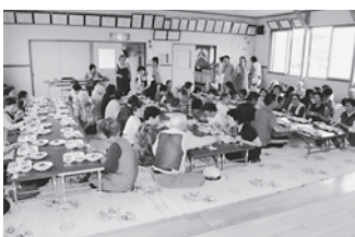
一人暮らし高齢者給食サービス事業