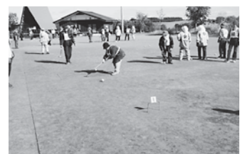
高齢者ゲートボール大会