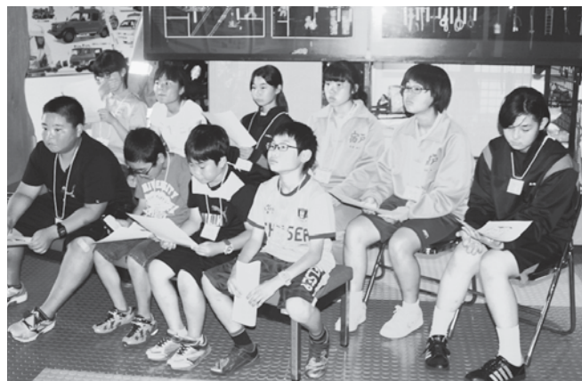
県立総合防災センター職員の説明に耳を傾ける参加者たち