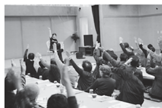
一人暮らし高齢者集い