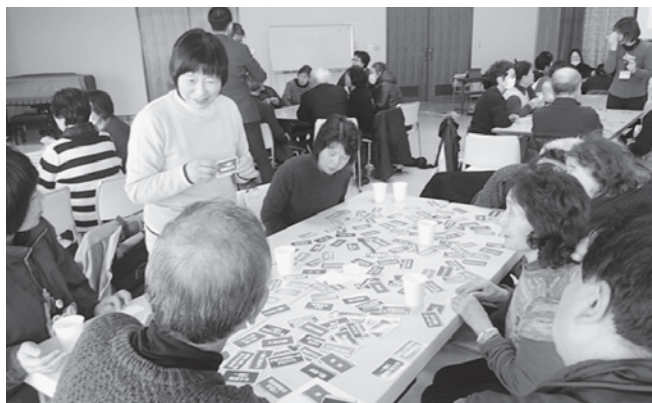
参加者同士で交流しながら行った助け合い体験ゲームの様子