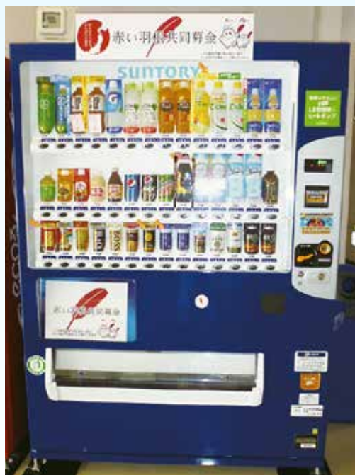
赤い羽根自動販売機（イメージ）

岩手県共同募金会洋野町共同募金委員会では、地域福祉を推進するための財源確保のため、「赤い羽根自動販売機」の設置推進に取り組んでいます。この自動販売機は、清涼飲料水の自動販売機による売り上げの一部を寄付していただくもので、この募金は「ふれあいいきいきサロン事業」「一人暮らし高齢者給食サービス事業」等、設置した地域の様々な地域福祉活動に活用されます。