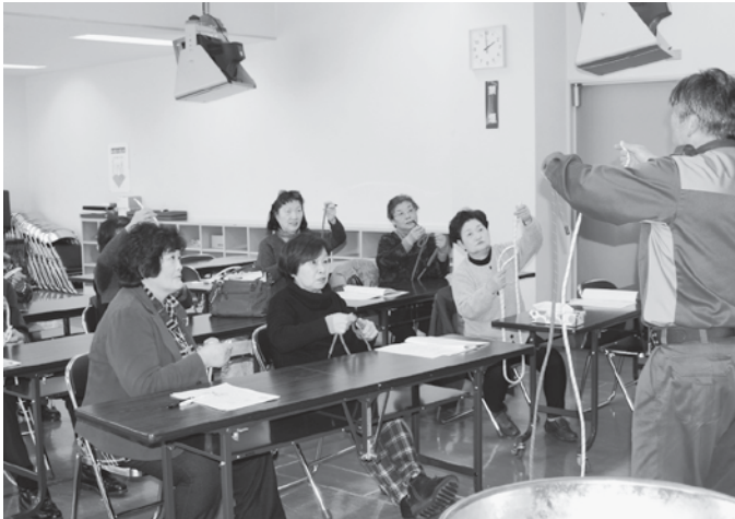
(写真上) 救助活動の際に役立つロープの結索方法について学習する参加者たち

参加者たちは、防災に対する正しい知識や日頃からの備えの重要性について理解を深めました。