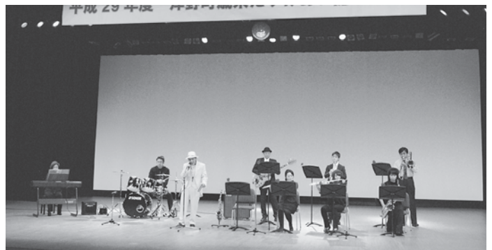
歳末たすけあい運動の一環として開催された歳末たすけあい隠し芸大会の様子