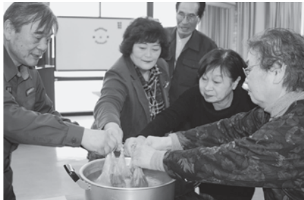
(写真右) 炊き出し体験の様子