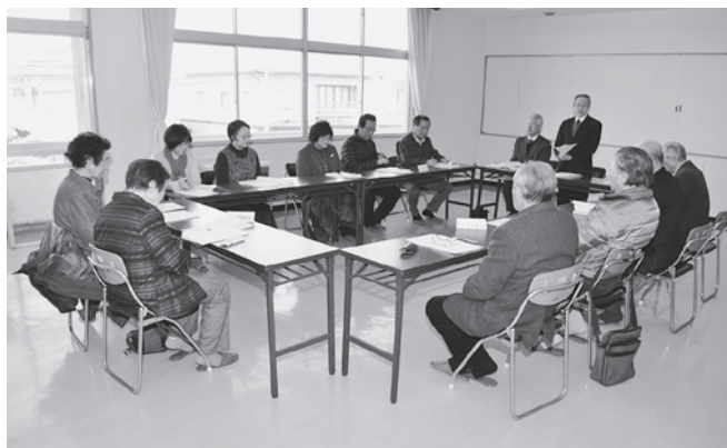
各福祉団体の代表者等が参加した懇談会の様子