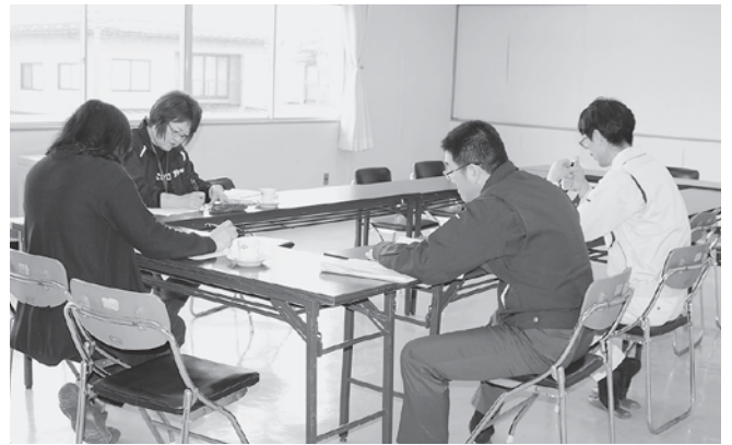
被災者の今後の支援等について情報交換する参加者たち