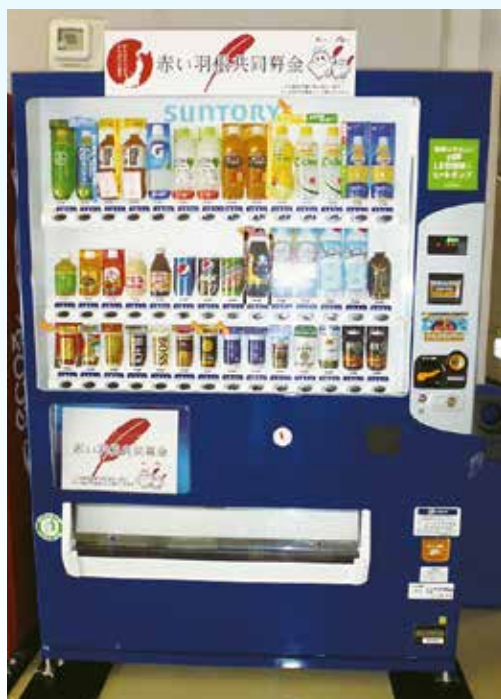
赤い羽根自動販売機（イメージ）

岩手県共同募金会洋野町共同募金委員会では、地域福祉を推進するための財源確保のため、「赤い羽根自動販売機」の設置推進に取り組んでいます。この自動販売機は、清涼飲料水の自動販売機による売り上げの一部を寄付していただくもので、この募金は「ふれあいいきいきサロン事業」「一人暮らし高齢者給食サービス事業」等、設置した地域の様々な地域福祉活動に活用されます。