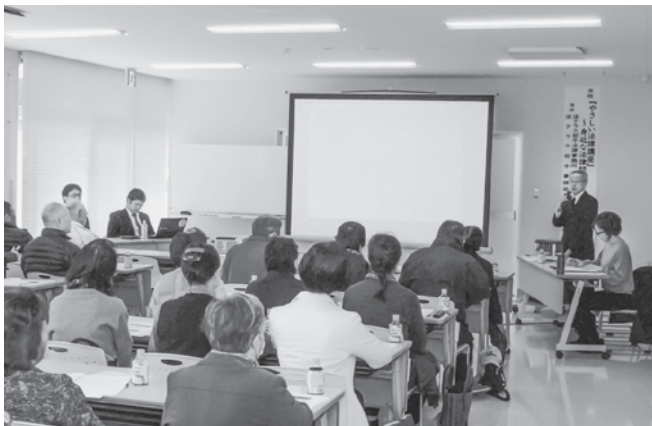
平成30年度第4回社会福祉講座の開会行事の様子