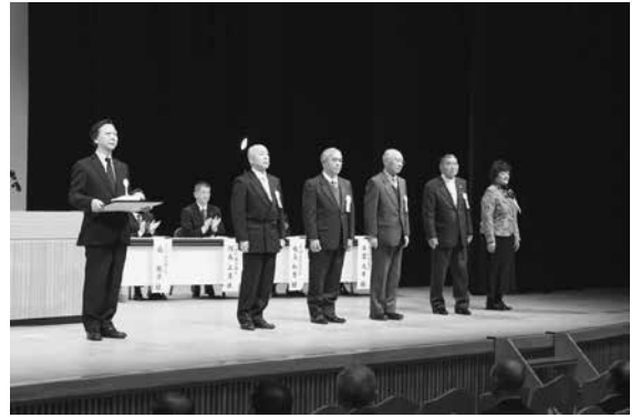
洋野町社会福祉協議会長表彰を受賞した被表彰者