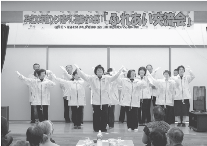
(写真上) 民生児童委員の皆さんによるアトラクションの様子