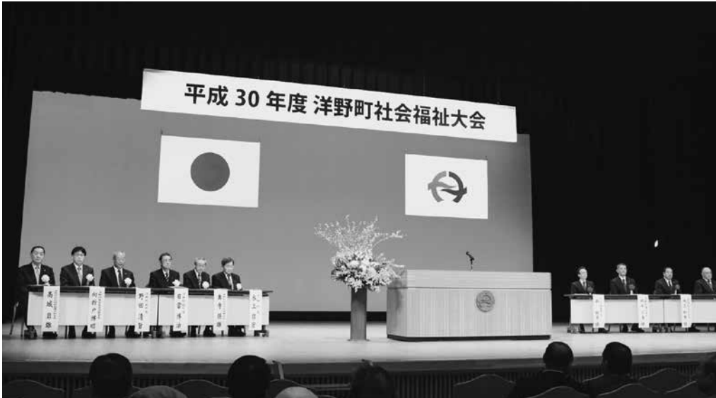
平成30年度洋野町社会福祉大会式典の様子