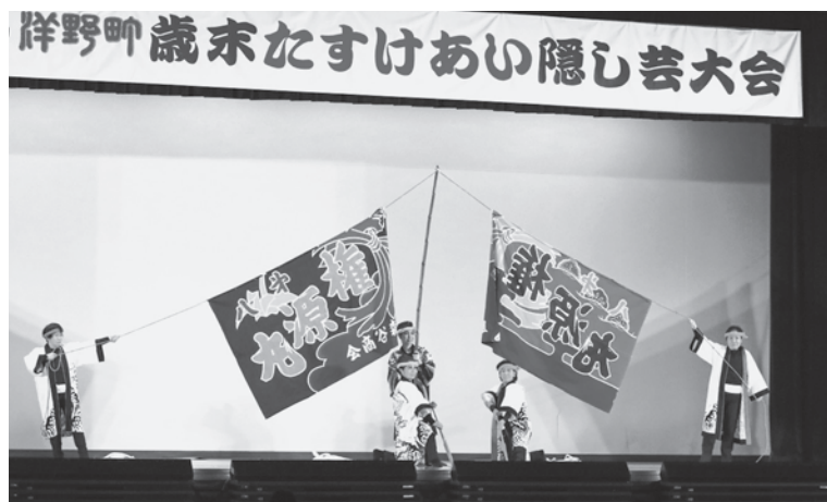
歳末たすけあい運動の一環として開催された歳末たすけあい隠し芸大会の様子