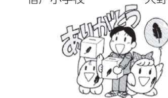
向田小学校・種市中学校・種市高等学校

※ 種市小学校・宿戸小学校・種市高等学校は、昨年度の運動期間終了後にご協力いただいた募金も含まれています。 ※ 帯島小学校は、今年度の運動期間終了後(募金実績確定後)にご協力をいただいたため、翌年度の募金実績として取り扱うこととなります。