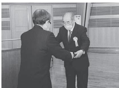
洋野町長表彰を受賞する平内老人クラブ喜楽会様