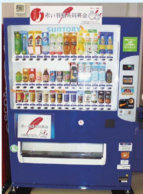
赤い羽根自動販売機（イメージ）

岩手県共同募金会洋野町共同募金委員会では、地域福祉を推進するための財源確保のため、「赤い羽根自動販売機」の設置推進に取り組んでいます。この自動販売機は、清涼飲料水の自動販売機による売り上げの一部を寄付していただくもので、この募金は「ふれあいいきいきサロン事業」「一人暮らし高齢者給食サービス事業」等、設置した地域の様々な地域福祉活動に活用されます。